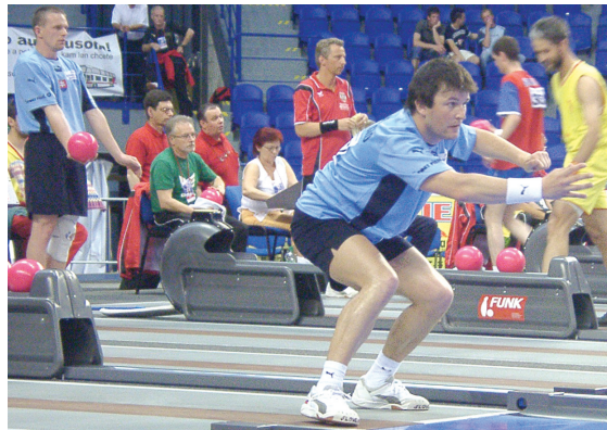
Kegel-WM in Košice: Mannschaftswettbewerb HERREN (Achtelfinale)

VORSCHAU. ■ Heute Wettbewerb Tandem MI-XED unter Teilnahme von 32 Paaren. ■ Donnerstag: Viertelfinalespiele DAMEN mit Rumänien – Polen, Tschechische Republik – Slowakei, Serbien – Slowenien, Ungarn – Deutschland. Viertelfinalespiele HERREN mit Slowenien – Mazedonien, Kroatien – Rumänien, Polen – Ungarn und Deutschland – Österreich